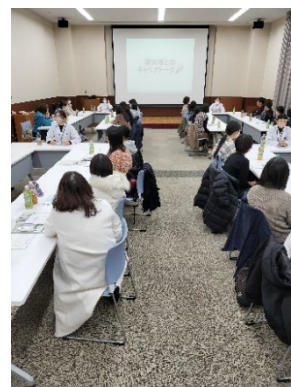
女性研究者との キャリアトーク