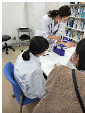
肌診断でライスパワー エキスの効果体感!