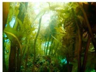
構造物に繁茂した海藻

※ 知識をより深めたい受講者には来年4～8月にリカレント専門講座を開催予定です。