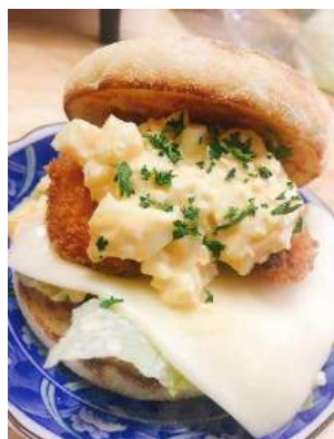
ハマチフィッシュバーガー

パティは県魚であるハマチの切り身をフライにしてサクッと食感を出しています。タルタルソースには東かがわ特産のパセリをアクセントして加え、レタスをサンドしました。