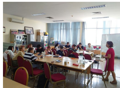
農学部生が英語で授業を受けている様子