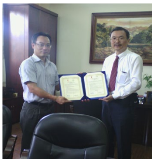
学長から協定書の受理