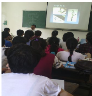
香川大学紹介風景