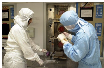
ナノテク研究用の先端的クリーンルーム