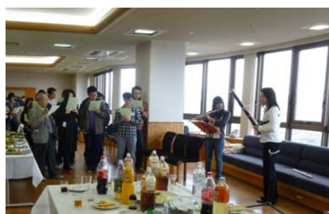
吹奏楽クラブ「アンサンブル・コン・ブリオ」の伴奏による合唱