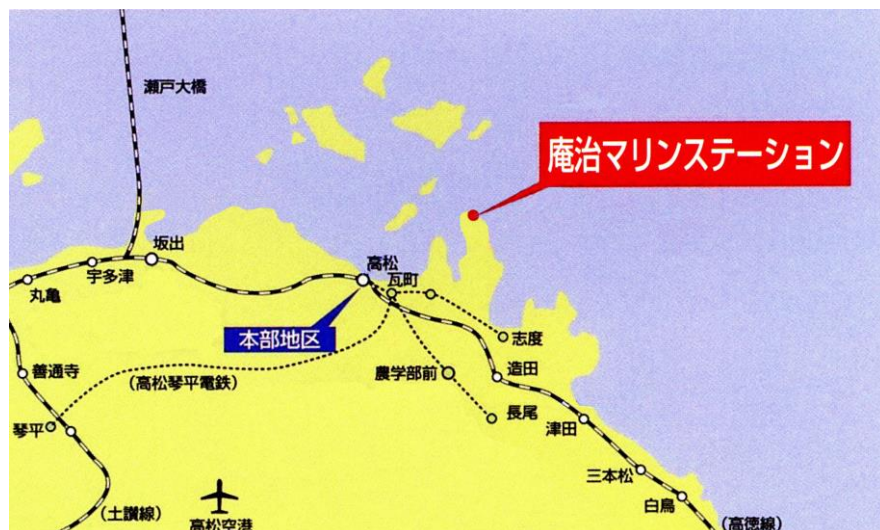
庵治マリンステーション全景

瀬戸内圏研究センターへの改組に伴って、平成22年3月までに、マリンステーションの施設をリニューアルしました。