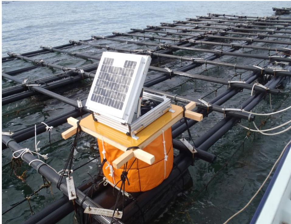
図2 志度湾のカキ筏上にて稼働中の貝リングル