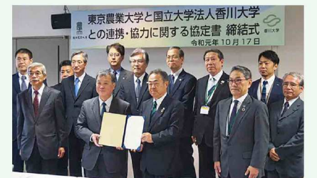
東京農業大学と香川大学の関係者協定書を掲げる東京農業大学 高野学長(左)と寛学長(右)

る発展を目指すとともに、社会にその成果を還元し、我が国の発展に寄与することを目的とするものです。協定の締結により、農学の幅広い分野で、特色ある教育研究に実績のある東京農業大学との間で、様々な学生・研究者の交流機会とともに、農業や関連産業の振興等、地域社会との連携が拡大することが期待されます。