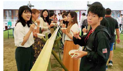
小豆島といえば素麺！長い竹を使った流し素麺を美味しく頂きました。"同じ釜の飯を食う"みんな、良い笑顔です。