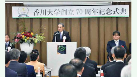
記念式典で挨拶する寛学長