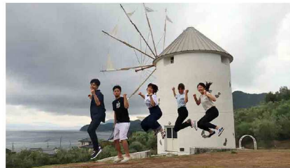
グループで小豆島の観光名所その他諸々を散策。小豆島の魅力が盛り沢山。ここは魔法の宅急便のロケ地です^^