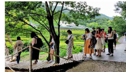
瀬戸内国際芸術祭の作品を見学。デザイン系を専攻している学生が多かったこともあってみんな目が輝いています。