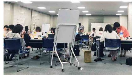
最終日のプレゼンに向けて各グループ夜遅くまでプレゼン準備。かけがえない仲間と過ごした貴重な時間でした。