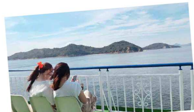
初めての小豆島！船上の海風は気持ちいい！ワクワクとドキドキの旅に出発！美しい瀬戸内海をパシャリ！