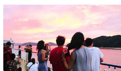
き、綺麗すぎる…！夕日が小豆島をより一層名残惜しく感じさせます。何とも言えない温かい気持ちになりました。