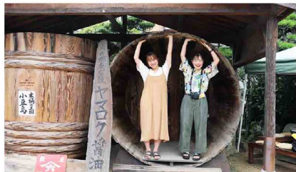
ヤマロク醤油さんを訪問。独自の技術で造られた大きな醤油樽と普段見ないような物凄い量の醤油に圧倒されました。