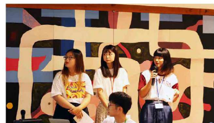
最終日。達成感の嵐。眠気と戦いながらも仲間と頑張って仕上げたプレゼンに熱意をこらしました。