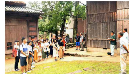
地元の伝統芸能についてお話を伺っています。伝統を受け継ぎ、守っている地元の方々のお話に興味津々です。

私は「うまげな小豆島を感じてみたい」という香川大学と東京圏の大学で実施している対流促進事業のプログラム（学内開講科目名：「地域をデザインする（夏季集中）」）に参加しました。私自身、香川県出身ですが小豆島に行くのは初めてで、そうめんとオリーブが有名であるという以外何も知りませんでした。私は医学部看護学科に所属していて、正直なところ「地域をデザインする」なんて、私は場違いなのでは？」と思っていました。このプログラムでは、学部や専門分野は関係ありません。他大学の学生と考えを共有したり仲を深めたり色々な人間性に触れることができ、さらには「自分は何かを創造・創起することが好きである。」という自分の新たな一面を知ることができ、「自分の専門性を地域活性化に繋げたい。」と考えるようになりました。単に単位取得のために気軽に参加したプログラムが、私の将来のキャリアへの意欲向上に繋がるとは思いもしませんでした。何でも挑戦してみるものです。「地域をデザインする」→「地域をデザインしてみたい」に至った私の「→」を、皆さんにもぜひ体験してもらいたいです。