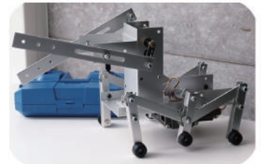
6足歩行ロボット BOXER (ボクサー)