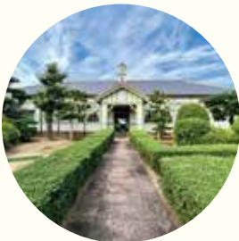
三木町池戸公民館(三木町指定文化財)