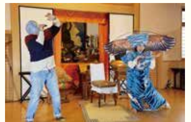
坂田ゆかり演出「テラ 茶都編」/2021年

2014年「アルカサバ・シアター(ハレスチナ)との共同制作『羅生門 藪の中』」を演出(フェスティバル/トキョー14)。2016年、 建築家ホルヘ・マルティン・ガルシアと8名の高校生と共に制作した「Dear Gulives」瀬戸内国際芸術祭2016「複雑なトポ グラフィ」展/特別名勝栗林公園は、2018年ロンドンでのアップデートを経て第16回ヴェネチア建築ビエンナーレのスペイ ニングに参加。同2018年に演出した「まちなかパフォーマンス「テラ」(フェスティバル/トキョー18)が、2020年のパンデ ミックをきっかけとし、日本・タイ・ミャンマー・インドネシア・ベトナムのアーティストによるアジアの遠隔協働プロジェクト「テラジプ」隔離の時代を旅する演劇」に発展。以来、プロジェクトにおける中心的な役割を担う。2022年、 International Theatre Institute (ITI/UNESCO) World Theatre Dayに、日本代表のエマージング・アーティストに選出 された。 https://yukarisakata.com/