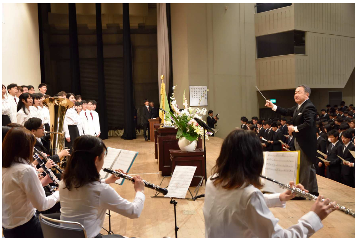
算学長の学歌指揮風景