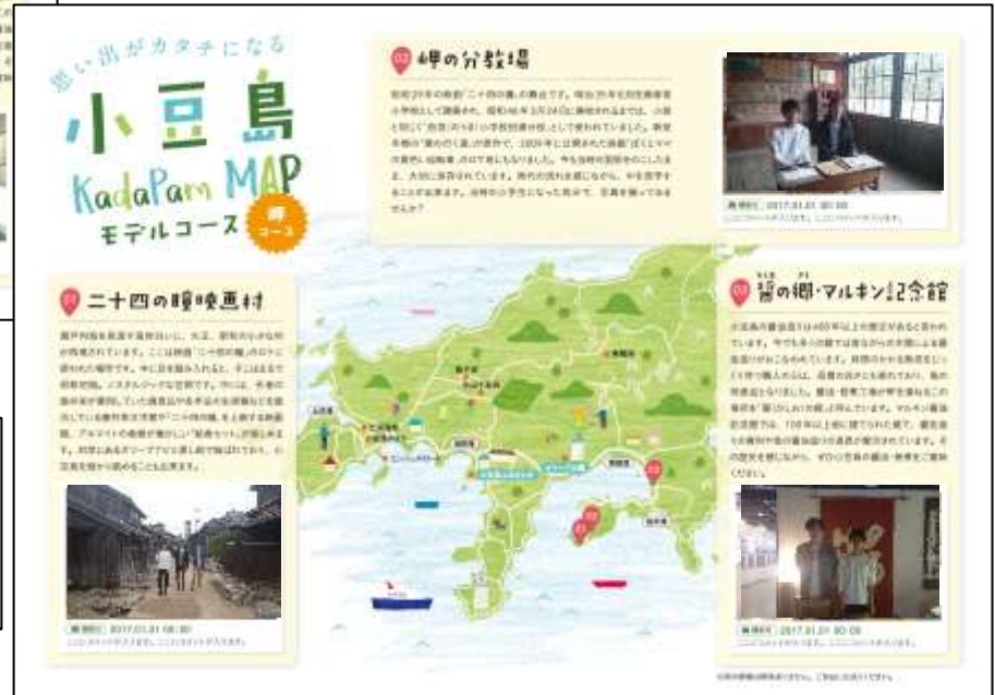
図 カダパンガイドブック裏面(観光前)