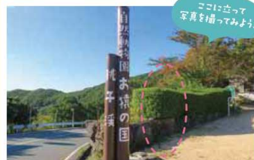
ここに立って写真を撮ってみよう！