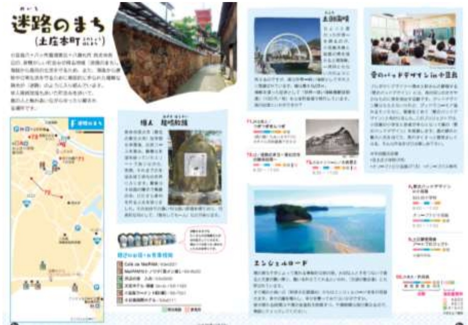
図 観光ガイドブック

まるごと小豆島・豊島本 秋 http://marugoto-shodoshima.jp/pamph/2016autumn.pdf