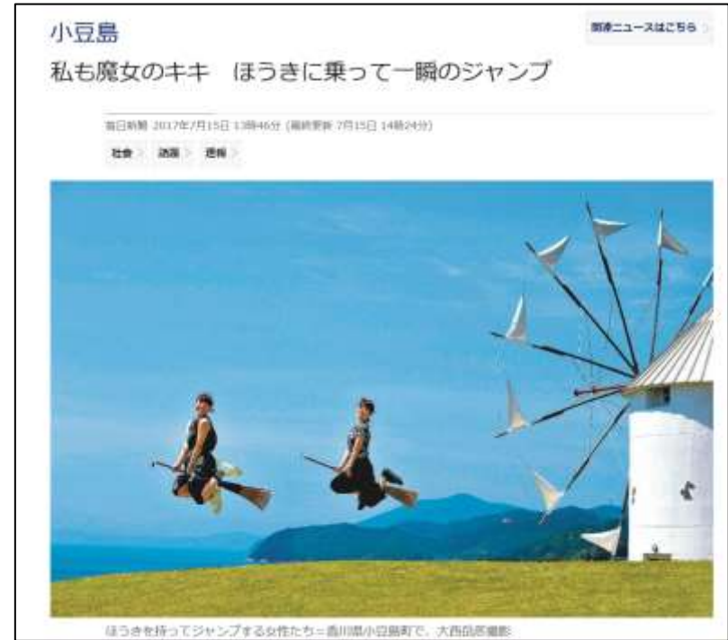
図 私も魔女のキキ(毎日新聞)

観光ガイドブックには観光地の魅力がつまっているが、観光期間しか利用されない →多くの方にガイドブックを発信したい!