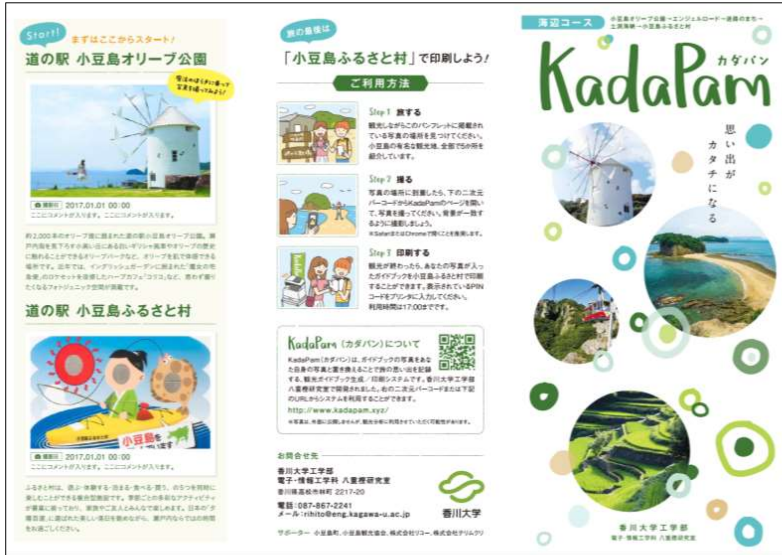
図 カダパンガイドブック 表面(海辺コース)