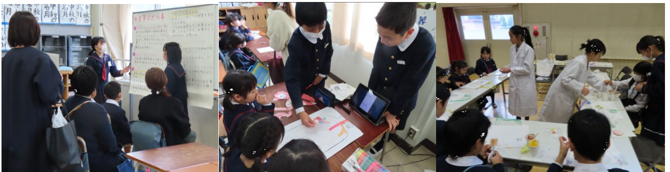
6年生「おしごと体験」コーナーの様子（予定）