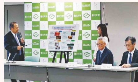
記者会見で説明する寛学長