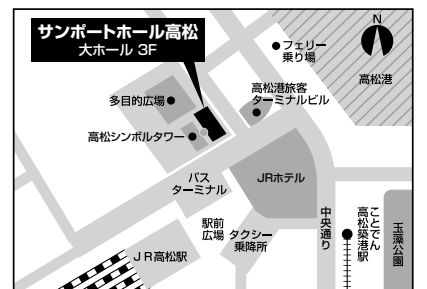
JR高松駅から徒歩3分 ことでん高松築港駅から徒歩5分 駐車場/サンポート高松地下駐車場

http://www.ed.kagawa-u.ac.jp/ (香川大学教育学部)