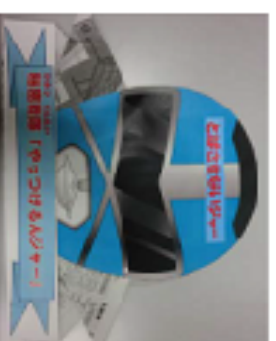
とばさせないビジャー