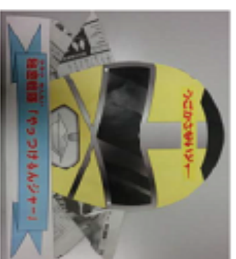
うごかさないビジャー