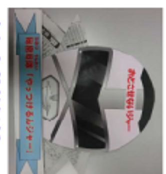
おとさせないビジャー