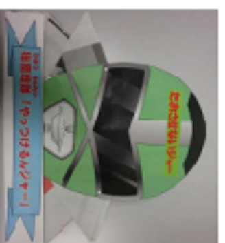
たおさせないビジャー