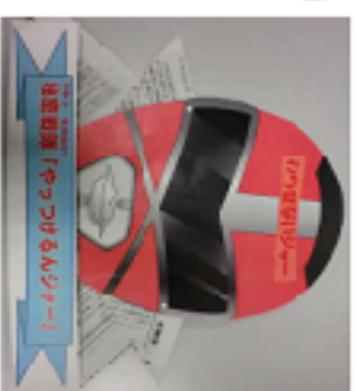
わらせないビジャー