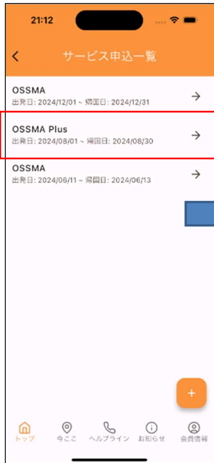
該当のOSSMA Plusの渡航内容を選択