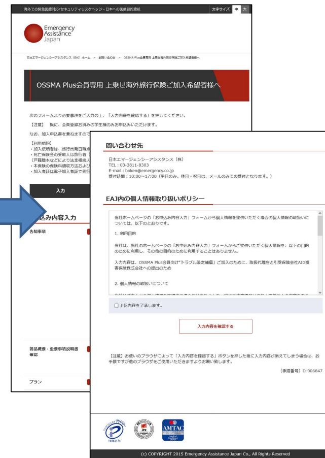
申込画面に遷移するので、情報を入力し、申込み