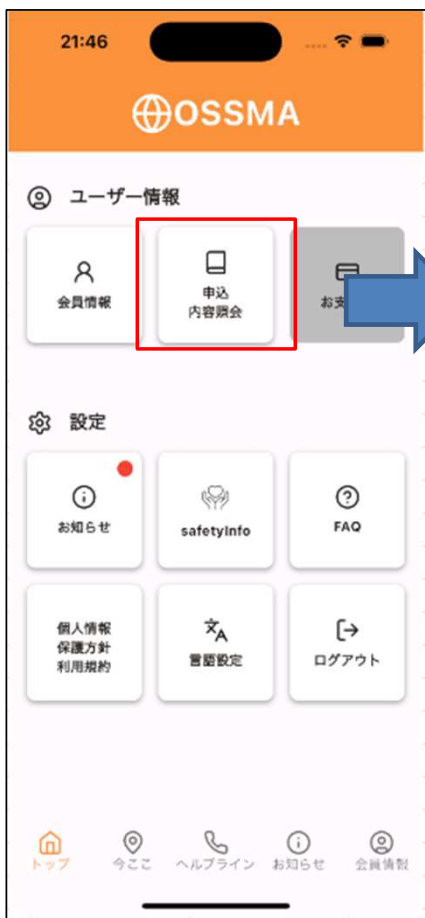
アプリの「申込内容照会」