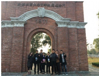
浙江工商大学正門