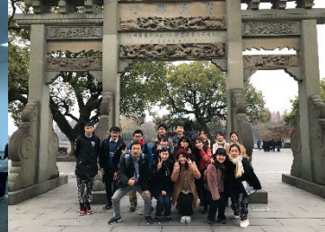
市の中心にある西湖