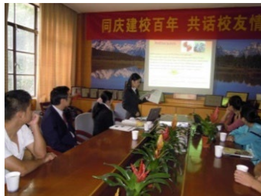
両大学院生による研究発表会風景 (食品及び生物工程学院にて)