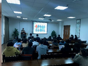
浙江工商大学学生の参加