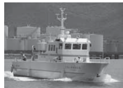
▲香川大学の調査船「カラスⅢ(19t)」