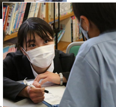
※写真はイメージです。 (開発前(5月)に、図書に対する児童の思いを聞き取る学生の様子)