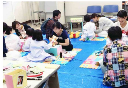
いつもたたくさんの“ちびっこ先生”たちでにぎわっています。