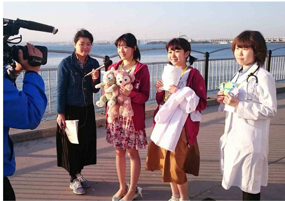
宇多津町でケーブルテレビの取材を受けました。