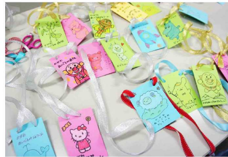
お土産のメダルは、すべて手作りします。