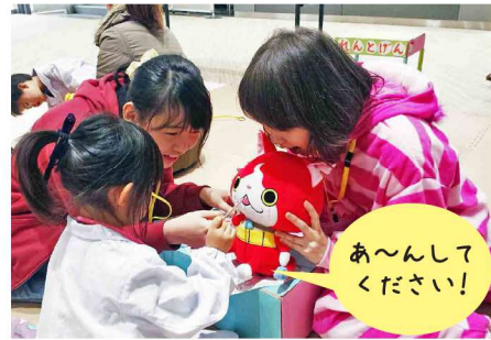
子供たちが医師になりきり、ぬいぐるみを患者に見立てて診察・治療します。私たち学生はそのサポートをします。

医学部学生によるボランティア団体「かがわぬいぐるみ病院」、発足して5年を迎えました。これからも、子どもたちの健やかな成長を願い、活動の場を広げていきます。