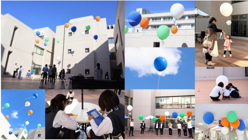
2022年11月に香川大学医学部附属病院で実現した空色ポストプロジェクトの様子