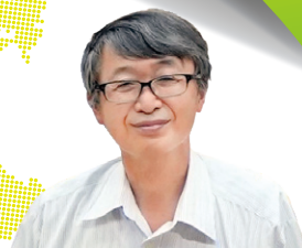
四国危機管理教育・研究・ 地域連携推進機構副機構長

「ブラタモリ」でおなじみの 長谷川先生とホームカミングデーで ブラブラしましょう!!