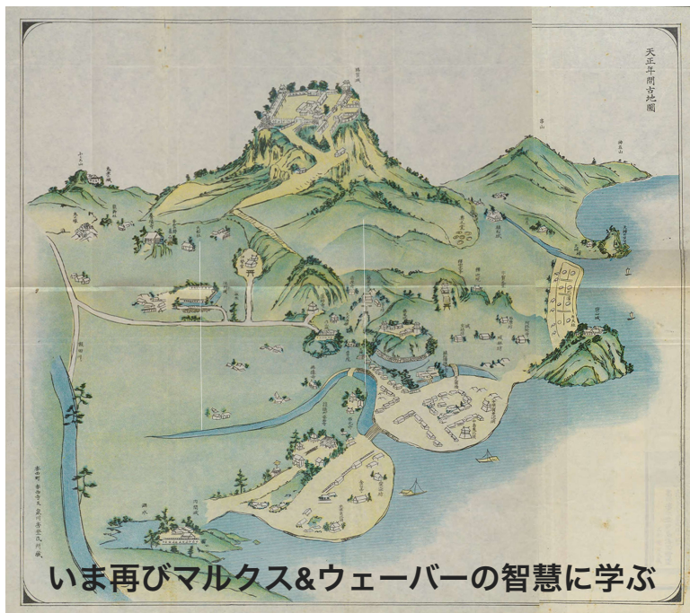
天正年間古地図（香川県香西町役場『香西史』香川新報社、1930年、所収）