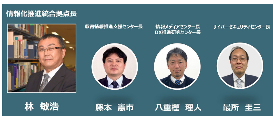
図：情報化推進統合拠点と学内連携部局