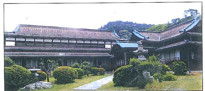
琴平町公会堂 (登録有形文化財)