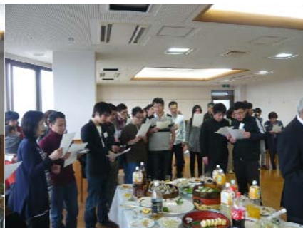
「上を向いてあるこう」斉唱