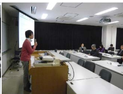
発表する学生の様子