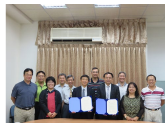
中正大学での協定調印式