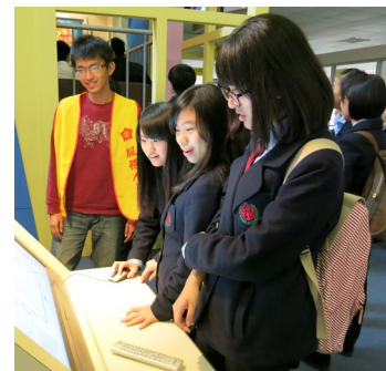
地震教育センター