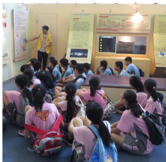
地震教育センター

●学部学生 約6,700人 ●大学院生 約4,900人 ●教職員 約1,000人 ホームページ https://www.ccu.edu.tw/ 交流協定締結年月日：2017年8月18日 主管学部：四国危機管理教育・研究・地域連携推進機構