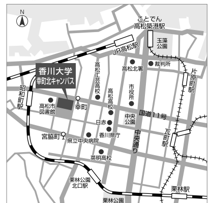
▼会場アクセスマップ