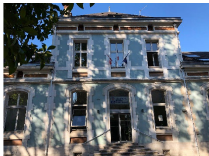
シャンベリーキャンパス本部