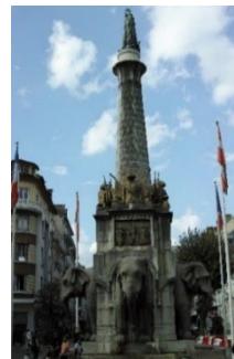
シャンベリーの街並み