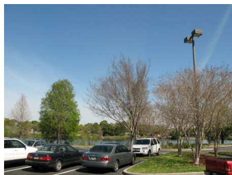
キャンパス内の様子

セントピーターズバーグ大学は、高松市の姉妹都市の1つである、アメリカ合衆国フロリダ州セントピーターズバーグ市に立地する公立大学である。1927年に私立の短期大学として設立されたが、1948年に公立化され、2001年に4年制大学となった。現在、セントピーターズバーグ市内を中心に8つのキャンパスをもち、4万6千人に近い学生を擁する、地域を代表する高等教育機関の1つとなっている。今後、高松市とセントピーターズバーグ市との長きにわたる交流を基礎に、両大学間で教育研究分野における活発な交流活動が図られることが期待されている。