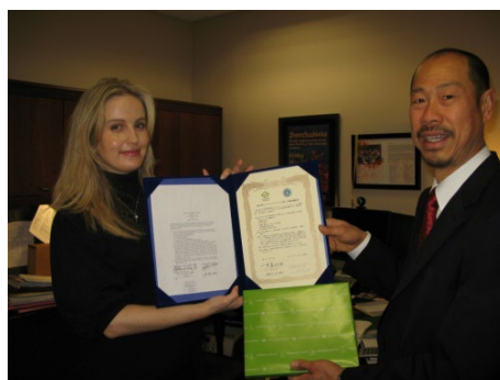
学術交流協定の締結