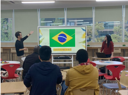
日研生が自分の国について説明