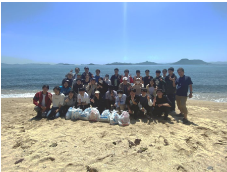
海岸でのフィールドワーク

また、学生によるサポート体制も整っており、サポーター、チューターがそれぞれ生活面と学習面で支援します。