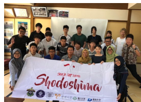
学生交流プログラム（インドネシア）