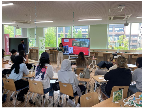
学生によるプレゼンテーション