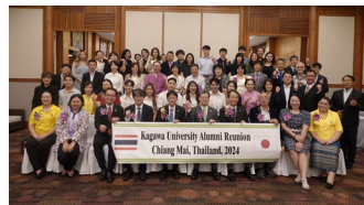
3大学合同シンポジウム（タイ）