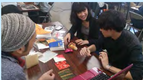
包装デザイン打合せ