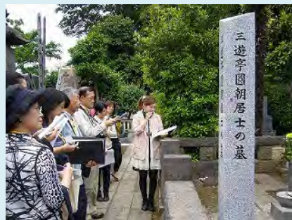
地域巡りガイドの様子