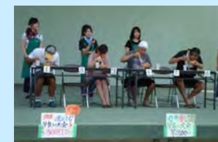
大学生が企画したイベント