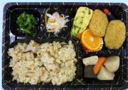
道の駅弁当「かなん冬の恵み」