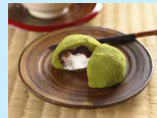
地元名産品「霧の森大福」