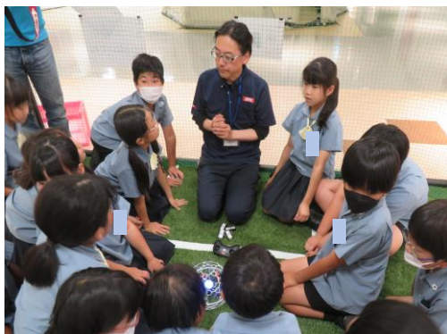
【講習を受けている様子】

つきましては、今後のプロジェクト活動の日程や内容について紹介させていただきますので、子どもたちや、共に活動を進める香川ドローンラボの皆様の様子を取材いただき、発信していただければ幸いです。