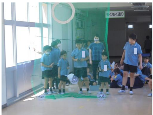
【校内で練習している様子】