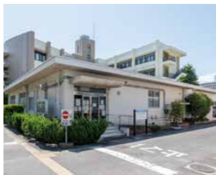
保健管理センター