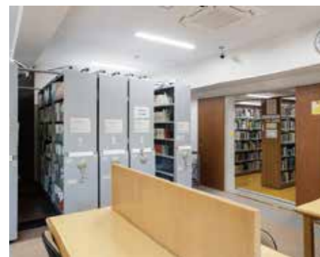
図書館農学部分館