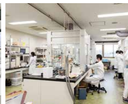
先端マテリアル科学コース実験室