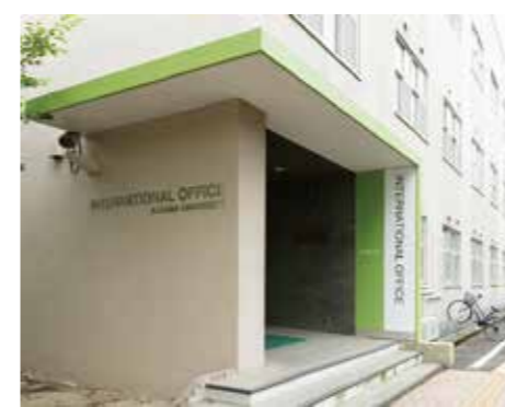
インターナショナルオフィス

人体の病理標本を見てスケッチを行う第6実習室など。 医学科2~4年生が学びます。