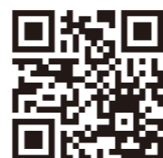
ますこさんが 紹介する動画が観られます!