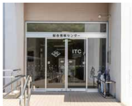
情報メディアセンター