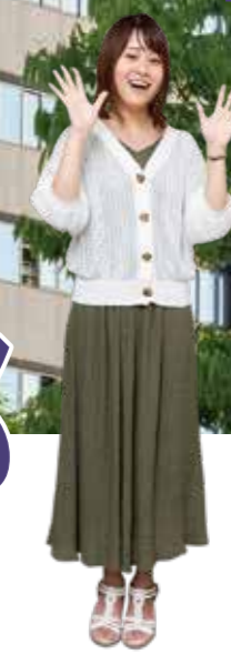
創造工学部 防災・危機管理コース 3年 みゆうさん