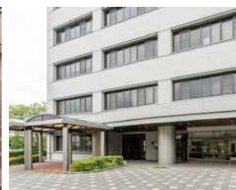
看護学科教育研究棟