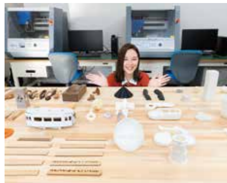
研究交流棟1階 デジタル加工室