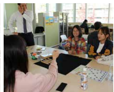
異文化交流イベント

履修授業に加えて、もっと語学を勉強したいという学生のために、 多言語のクラス(履修外)を開催しています。