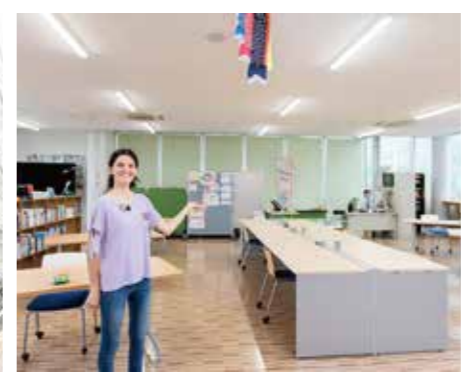
グローバル・カフェ

学生を海外に送り出したり、海外からの学生を迎えたり、 国際交流の窓口となっているインターナショナルオフィス。