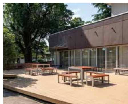
池戸会館 学生談話室・テラス