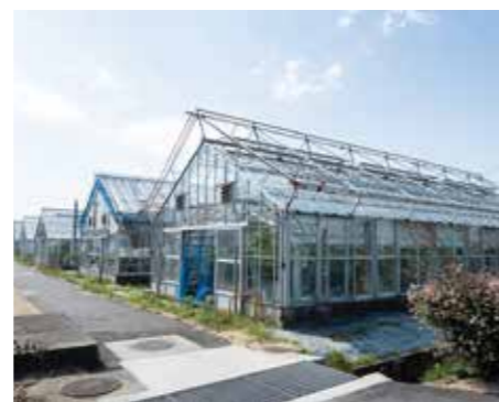
ビニールハウス・ガラス温室