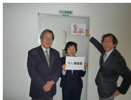
右から早川農学部長、松村特命講師、田島特命教授