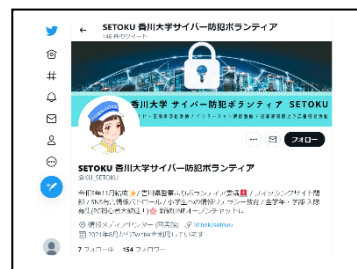
* SETOKU の公式アカウント