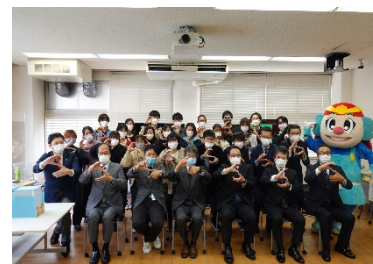
* SETOKU 結成時の写真