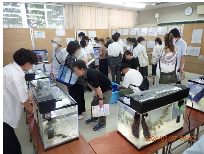
(参考) 過去の展示例(9月7日、高松桜井高校)