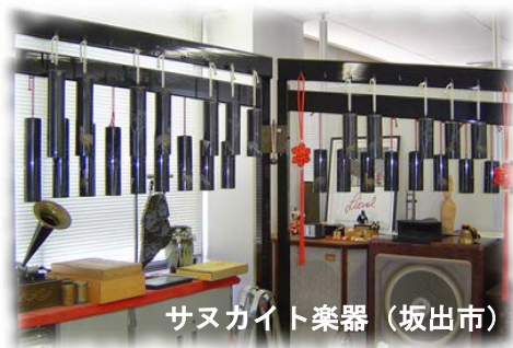
サマカイト楽器 (坂出市)

ジオパークは、大地の成り立ちから地域の強みと弱みを知り、強みを地方創生に、弱みを防災教育に活用し、地域の持続可能な発展をめざす活動です。本シンポジウムでは、地方創生の視点から、讃岐ジオパーク構想を推進する方策について意見交換を行い、推進体制構築のためのネットワーク作りをめざします。