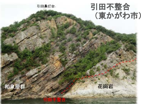
引田不整合 (東かがわ市)