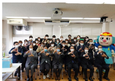
* SETOKU 結成時の写真