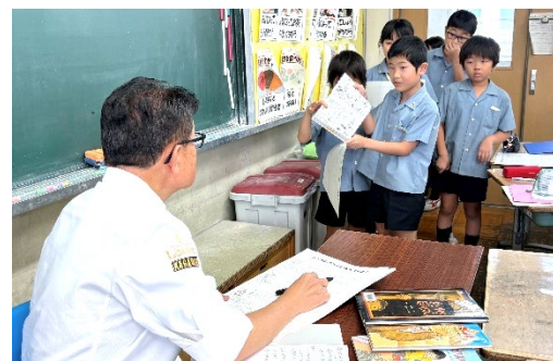
↑ カフェに置く本を提案する様子