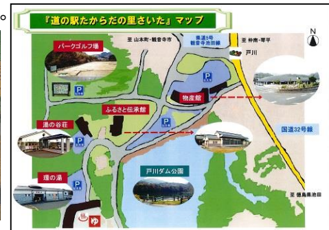
「たからだの里さいた」の現在の案内マップ