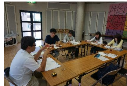
「ふるさと村」での打ち合わせの様子(H28年度)