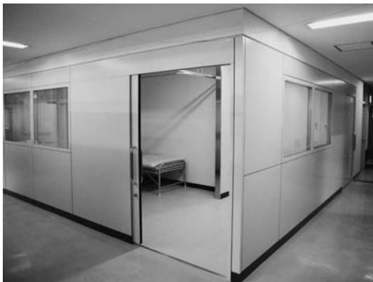
新しくなった休養室