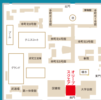
▲香川大学幸町北キャンパス

※駐車場がありませんので、公共交通機関もしくは周辺のコインパーキングをご利用下さい。