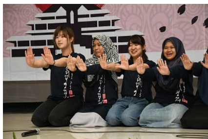
SUIJIサービ斯拉ーニング送別会(2019年3月)