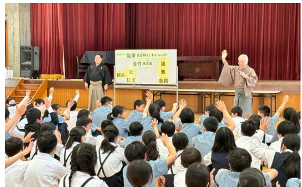
5月14日（火）に実施された6年生のワークショップ及びお稽古の様子