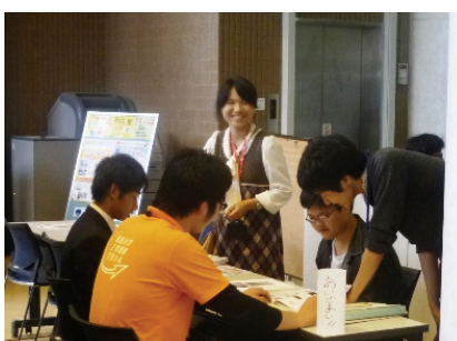
工学部祭企画 学生相談室