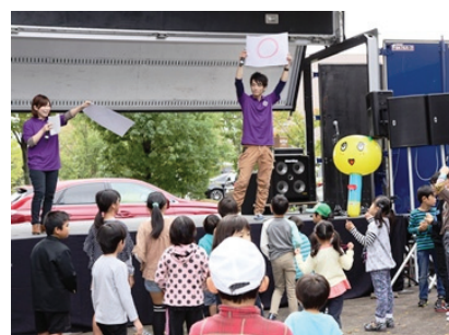
工学部祭ステージ ○×クイズ