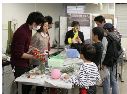
低温の不思議な世界