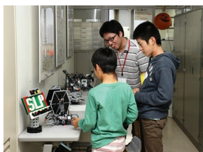
LEGO ロボットのプログラミング体験