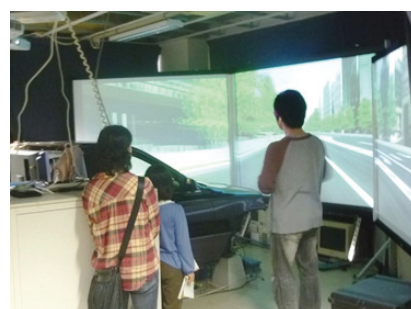
運転シミュレータの体験試乗