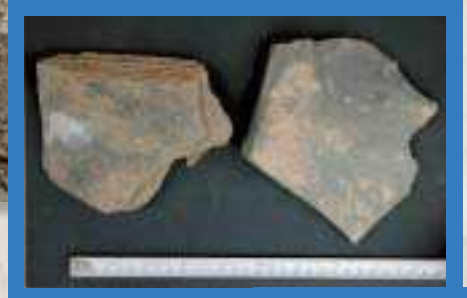
金山東2地点 板状石核 厚2.45 厚2.6cm