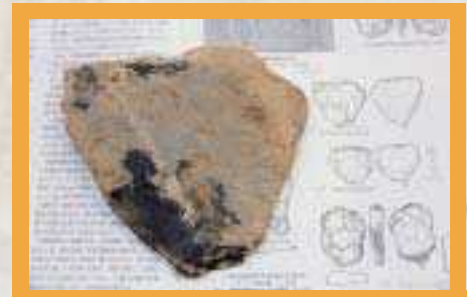
広島県帝釈・観音洞 板状石核 厚2.7cm