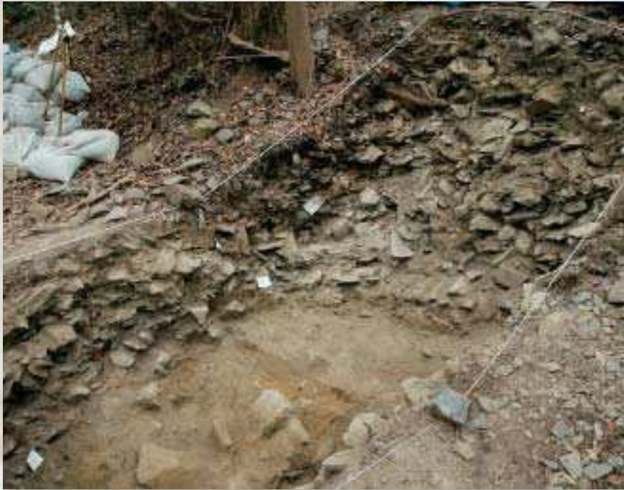
金山東2地点の発掘調査 2008年8月