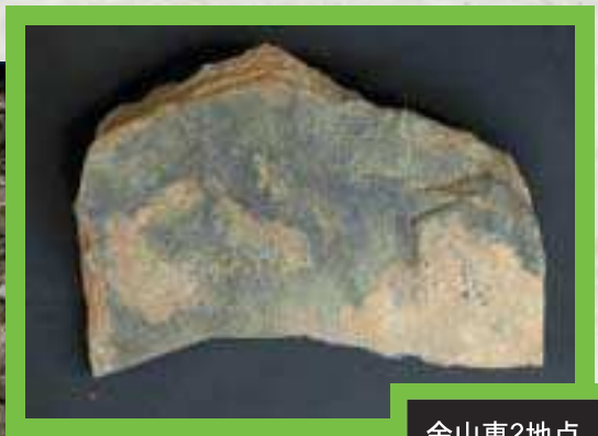
金山東2地点 板状石核 厚3.82cm