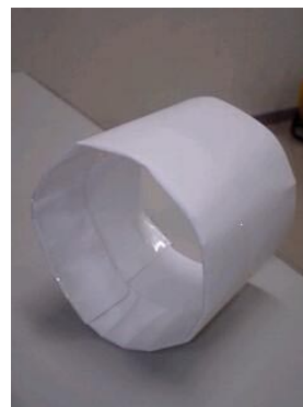
トルネードリング製作