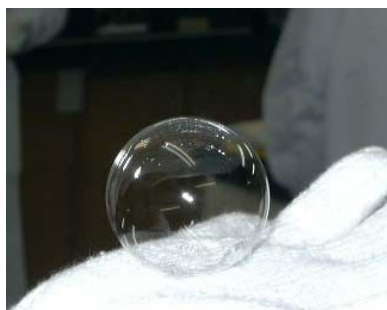
ミラクルシャボン玉