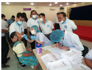
日本人歯科医師の健診