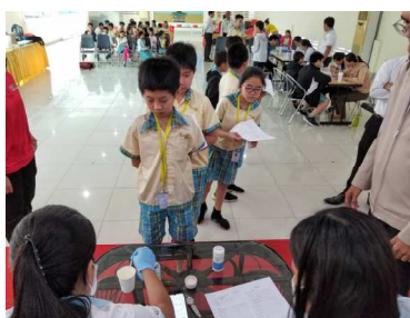
プノンペン市内私立小学校での内科健診