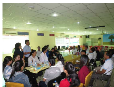
三宅実口腔外科学教授らと UHS 歯科医とスクールズ意見交換