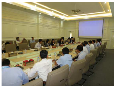
UHS 会議室での初日の講義 (歯科・内科)

【2019年11月から12月初旬にカンボジアプノンペンとカンダラン州小学校での学校歯科内科健診モデル事業】